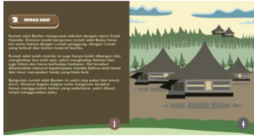
Gambar 4. Halaman 3-4 Buku Menelusuri Warisan Budaya Banten