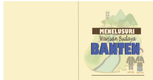
Gambar 2. Halaman Biodata Buku Menelusuri Warisan Budaya Banten