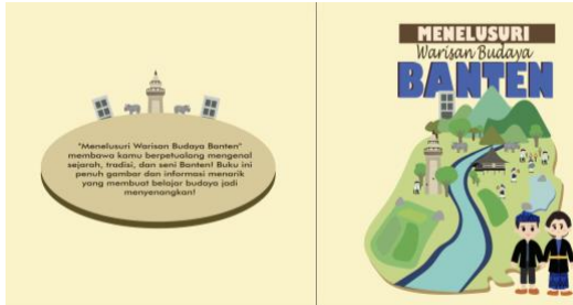
Gambar 1. Kover Buku Menelusuri Warisan Budaya Banten