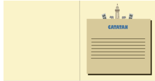
Gambar 8. Halaman Catatan Buku Menelusuri Warisan Budaya Banten