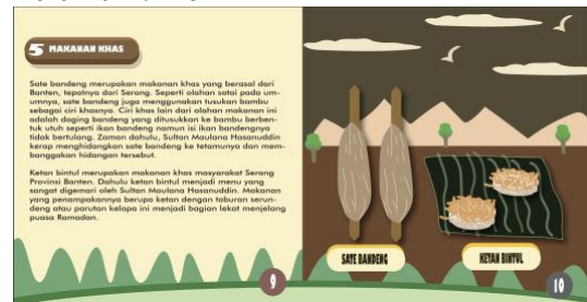
Gambar 7. Halaman 9-10 Buku Menelusuri Warisan Budaya Banten