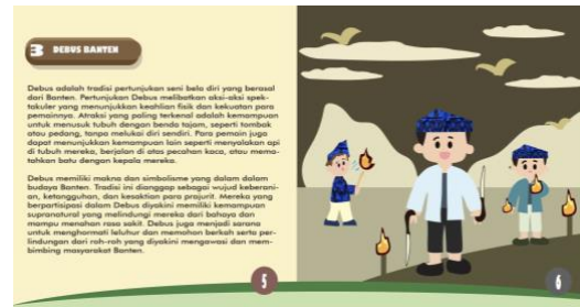
Gambar 5. Halaman 5-6 Buku Menelusuri Warisan Budaya Banten